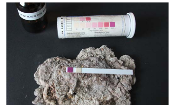
Analyse bauschädliche Salze