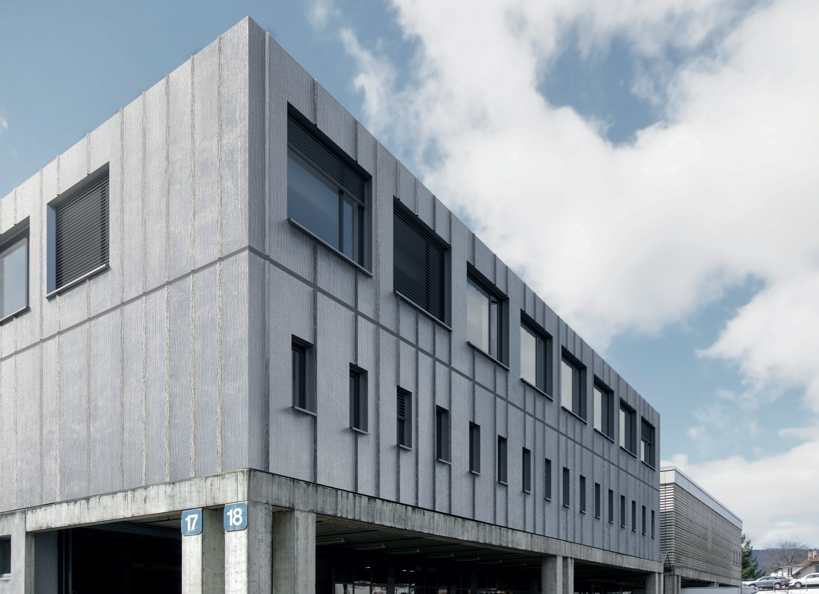
Die Fugen werden mit der Falzkonstruktion überwunden.