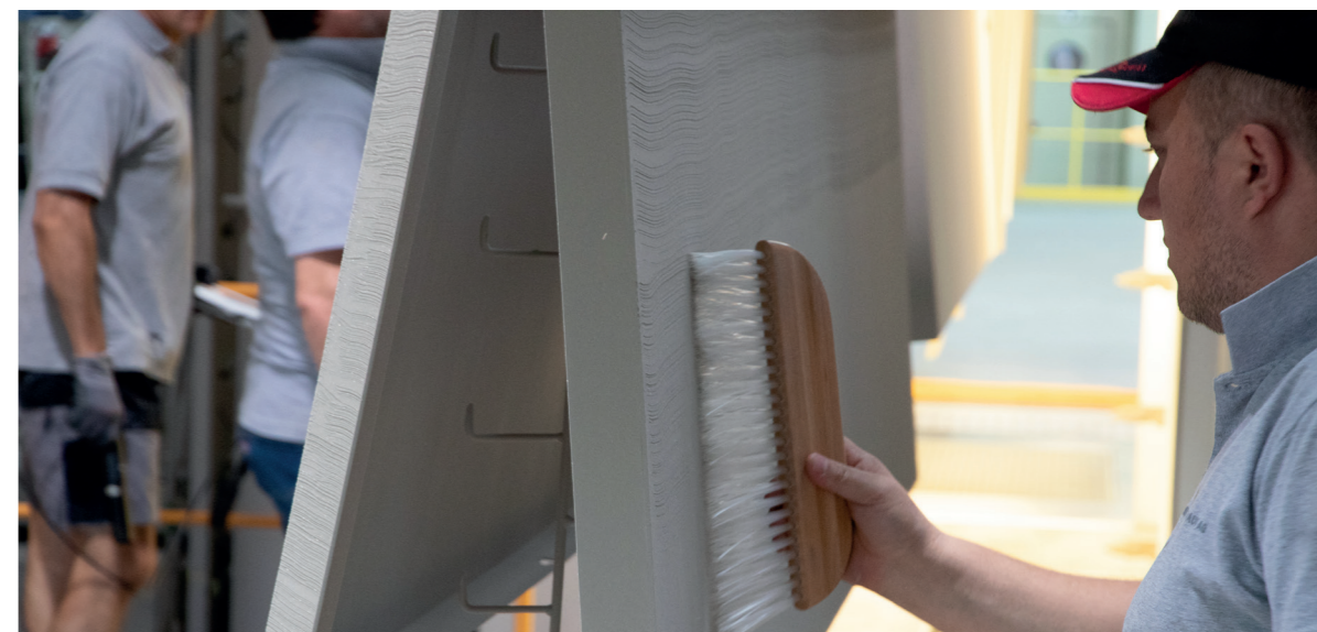
Hand- und Massarbeit ist gefragt.

Der Mut, Unbekanntes anzugehen, Neues zu probieren und das im ersten Moment unmöglich erscheinende konsequent zu verwirklichen, hat sich für alle Beteiligten also gelohnt. Allein schon die Fassade sichert der Kantonsapotheke Aarau einen speziellen Platz in der Architekturlandschaft der Schweiz.